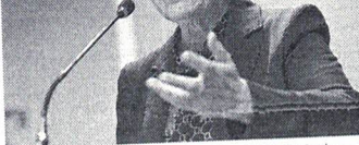
Ministra Tereza Cristina diz não acreditar que detecção de Covid-19 em embalagem de frango afetaria exportação brasileira

Mas, nos últimos meses, o país perdeu parte do mercado para Tailândia, Argentina e Chile, de acordo com a consultoria especializada Zhiyan. A ministra ressaltou que o Brasil adota protocolos contra a doença para coqueiras de soja, hortifruti-granjeiro e feiras livres.